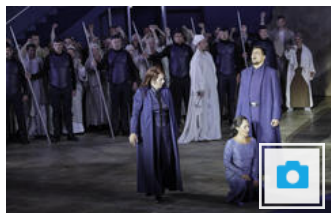
Hier sehen Sie Bilder von der Premiere der Sommeroper Nabucco in Kiel.